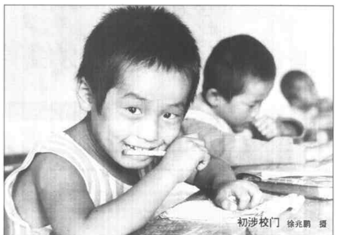
初涉校门

创名牌产品犯难的迷惘所在，也正是许多企业家不敢想，即使想到了也缺乏魄力去干的大题目。与“二次产品”新思维形成鲜明对照的是，时下我们有的企业经营管理者无视人才与产品的关系，不重视培养人才，急功近利已到了无以复加的地步。有的企业连青工进厂的岗前培训都不进行，青工进厂不久就让其上机床做计件的现象十分普遍。 俗话说：磨刀不误砍柴工。人才与产品正好比刀和柴的关系。试想，一个已用上了锋利无比的全钢刀，而另一个却还在用无刃的钝刀，砍起柴来怎么可以相提并论呢。从这个意义上讲，“二次产品”新思维已经给钝刀砍柴者亮起了红灯！ (继昌)